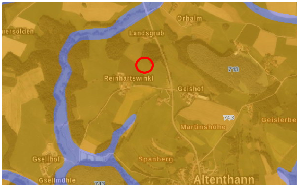
Bodenübersicht (nicht maßstäblich), Bayern Atlas 02-2022

Das Areal wird derzeit ackerbaulich intensiv genutzt. Der Untergrund besteht im geplanten Areal laut geologischer Bodenkarte von Bayern aus fast ausschließlich Braunerde aus skelettführendem (Kyro-)Sand bis Grussand (Granit oder Gneis).