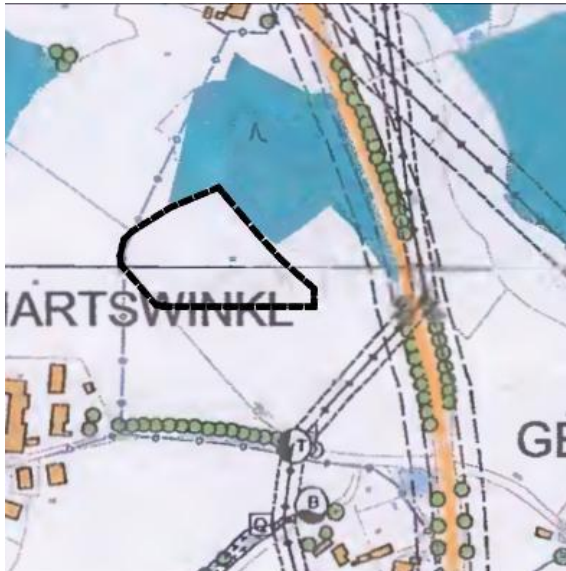
Auszug wirksamer FNP

Mit der Änderung des Flächennutzungsplanes von „Flächen für die Landwirtschaft“ in ein „Sondergebiet für die Nutzung von Solarenergie“ sollen die Voraussetzungen für die Errichtung einer Freiflächen-Photovoltaikanlage im Rahmen einer nachhaltigen städtebaulichen Entwicklung geschaffen werden.