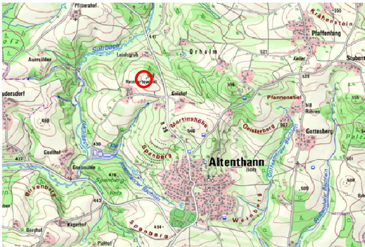
Übersicht (nicht maßstäblich), Bayern Atlas 02-2022

Aufgrund der örtlichen Gegebenheiten mit der angrenzenden Kreisstraße R 25, der Mittelspannungsfreileitung und vorhandener Einspeisemöglichkeiten stellt das Planungsgebiet eine optimale Fläche für die Realisierung des Vorhabens dar.