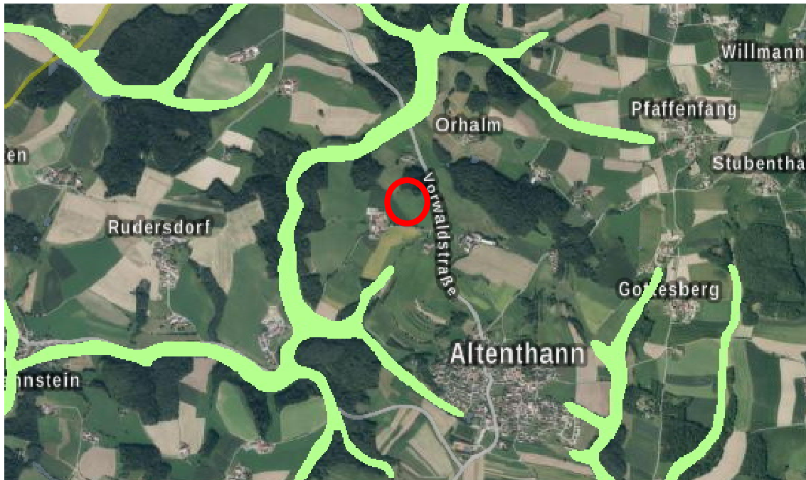
Wassersensible Bereiche (nicht maßstäblich), Bayern Atlas 02-2022

Oberflächengewässer sind im Planungsgebiet selbst nicht vorhanden. Wassersensible Bereiche oder Überschwemmungsgebiete sind durch das Vorhaben nicht betroffen, da das Bau- feld außerhalb dieser Bereiche liegt.