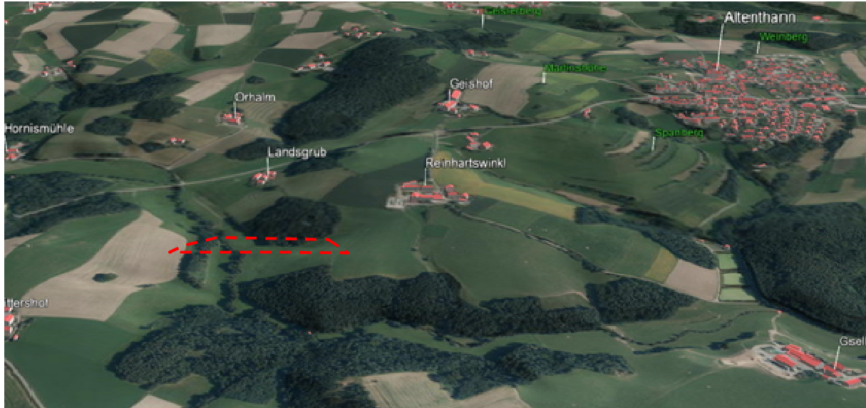
Ansicht von Westen, Bayernatlas 3D-Ansicht, Rot: beplanter Bereich, 02-2022