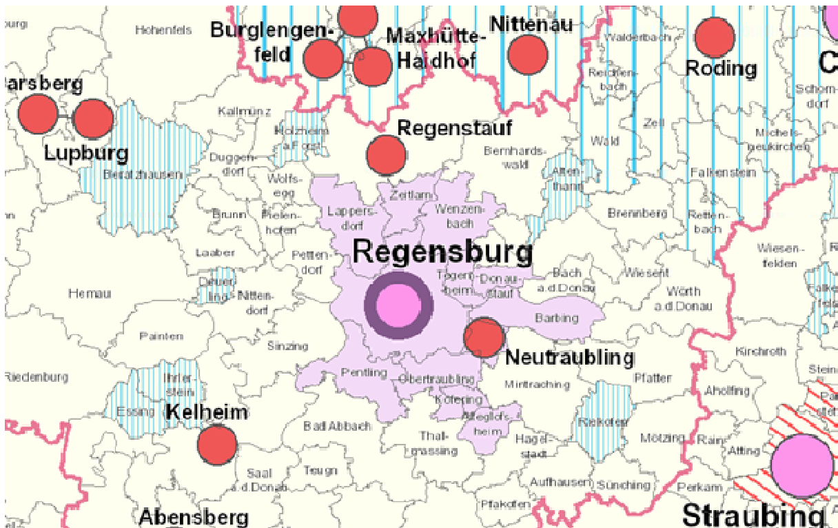
Raumstruktur, Regionalplan Region Regensburg (11), RISBY 02-2022

Das Areal liegt etwa 1 km nördlich des Zentrums von Altenthann in der Gemarkung Altenthann. Die Gemeinde ist Teil des Landkreises Regensburg und ist der Planungsregion 11 Regensburg zugeordnet. Wie auf der obigen Abbildung der Raumstrukturkarte zu sehen ist, befindet sich das Vorhaben im allgemein ländlichen Raum. Das nächstgelegene Mittelzentrum ist Neutraubling.