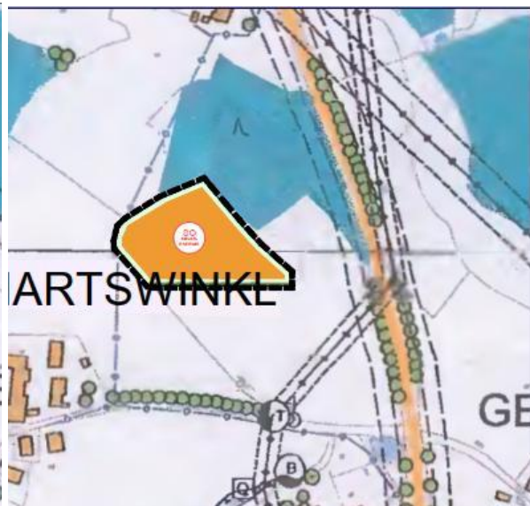
Auszug FNP geplant DB 2